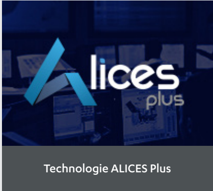
Technologie ALICES Plus