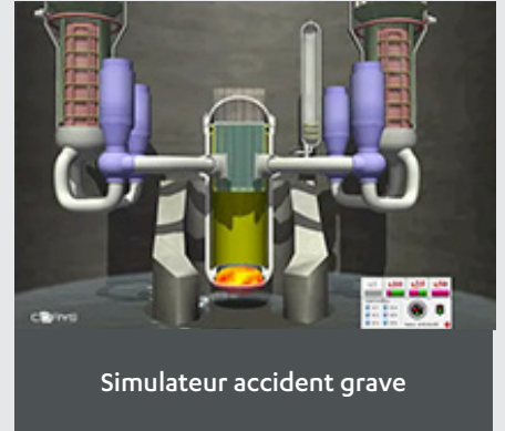
Simulateur accident grave