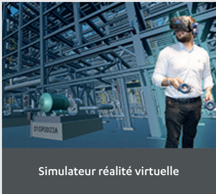
Simulateur réalité virtuelle