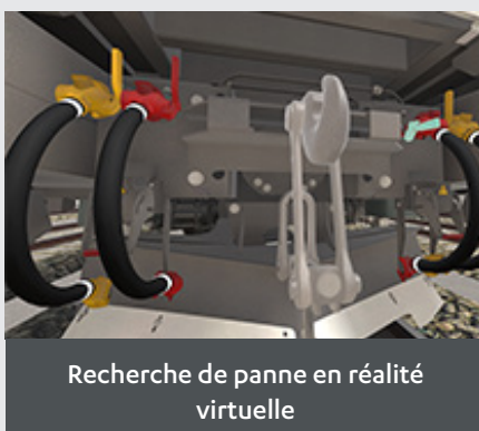
Recherche de panne en réalité virtuelle