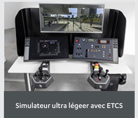
Simulateur ultra léger avec ETCS