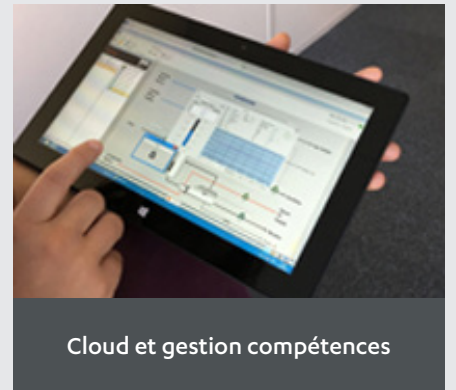
Cloud et gestion compétences