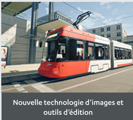
Nouvelle technologie d'images et outils d'édition