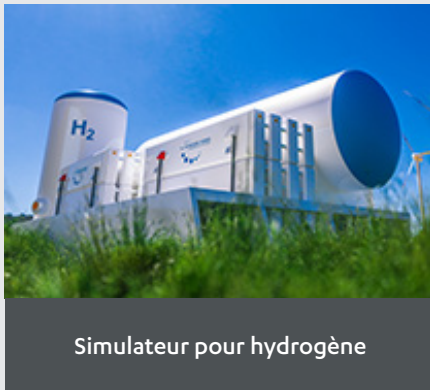
Simulateur pour hydrogène